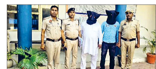
फतेहाबाद पुलिस गिरफ्त में धमकाने के आरोपी।