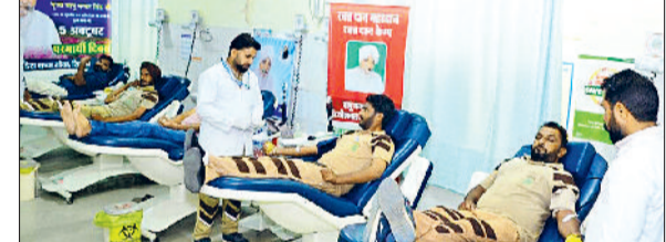
सिरसा। शिविर में रक्तदान करते हुए श्रद्दालु।