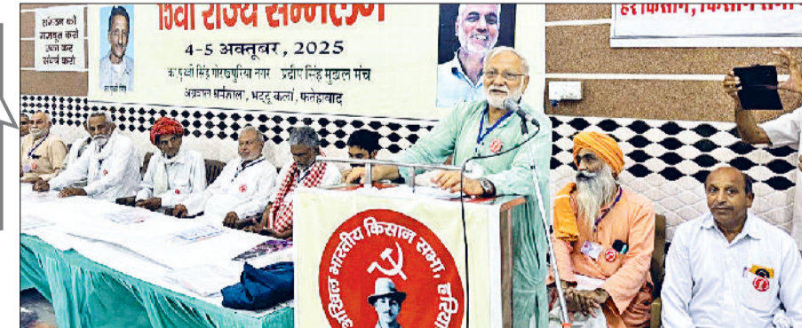
मट्टूकलां। किसान सभा के राज्य सम्मेलन को संबोधित करते किसान नेता।

अन्य सामग्री जबरन देने के विरोध में आंदोलन आयोजित करने का आह्वान किया। किसान सभा ने जिला कमेटियों को तत्काल बाढ़ प्रभावित क्षेत्रों से पानी की निकासी की मांग को लेकर युद्ध स्तर पर