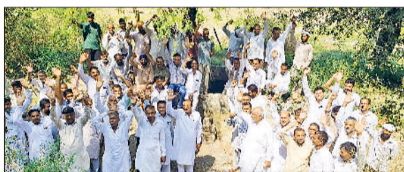
सिरसा। सिंचाई विभाग के खिलाफ रोष जाहिर करते किसान।