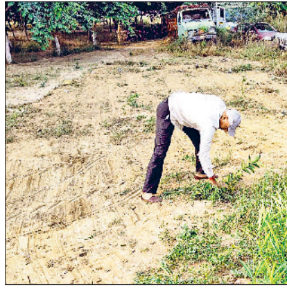
फतेहाबाद। थानों में साफ सफाई करते कर्मचारी।