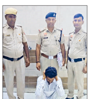
सिरसा। पुलिस द्वारा गिरफ्तार किया गया इनामी बदमाश।

डेढ़ साल से फरार चल रहा था आरोपी, सिर पर पांच हजार रुपये का इनाम