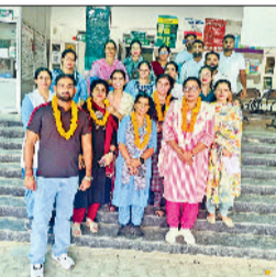
फतेहाबाद। नर्सिंग एसोसिएशन की बैठक में मौजूद सदस्य।