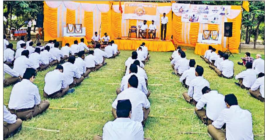
सिरसा। कार्यक्रम में भाग लेते स्वयंसेवक।

हरिभूमि न्यूज ▶▶ सिरसा स्वयंसेवक संघ का शताब्दी वर्ष पूर्ण होने पर नेहरू पार्क में कार्यक्रम का आयोजन किया गया जिसमें सैकड़ों स्वयंसेवकों ने पूर्ण गणवेश में भाग लिया। इस कार्यक्रम के मुख्य वक्ता कृष्ण हिसार विभागा कार्यवाह राष्ट्रीय स्वयंसेवक संघ थे। मुख्य वक्ता कृष्ण ने अपने उद्बोधन में संघ के 100 वर्ष पूर्ण होने पर सभी साक्षी स्वयंसेवकों को बधाई देते हुए कहा कि इन 100 वर्षों में स्वयंसेवकों की 4 पीढ़ियों ने त्याग, तपस्या से संघ को इस मुकाम तक पहुंचाया है और हम सब इसके साक्षी हैं। इस 100 वर्ष के कार्यकाल में संगठन को विभिन्न प्रकार की प्रताड़ना, उपहास और विचरित परिस्थितियों को सहना पड़ा। कई बार संघ पर प्रतिबंध लगा। संघ के स्वयंसेवकों की प्रताड़ना हुई, उन्हें जेलों में डाला गया। परंतु संघ का कार्य कभी रुका नहीं और दिन-प्रतिदिन बढ़ता ही गया।